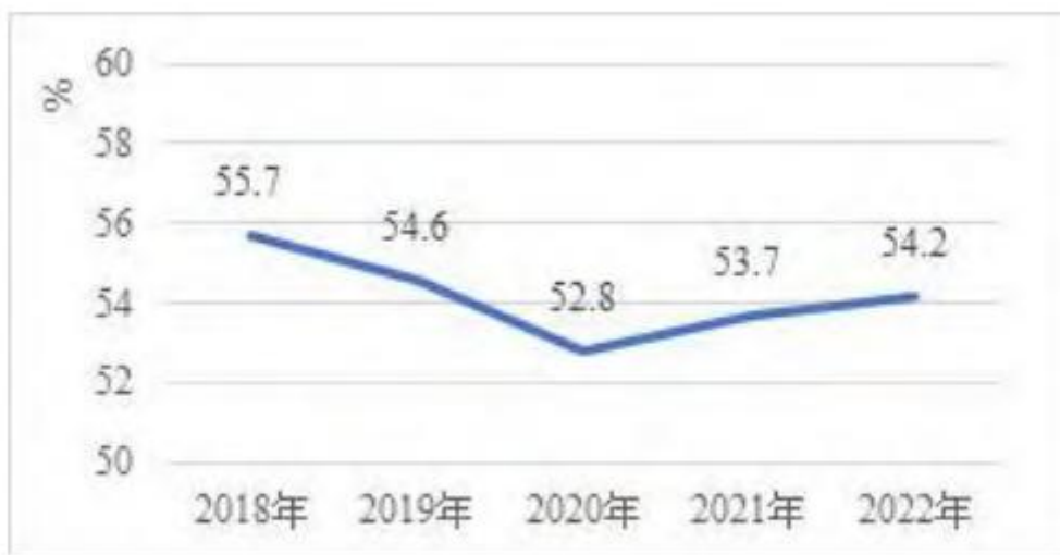
图2 湖北民营经济增加值占GDP比重(2018—2022)